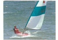
ディンギー (1人乗り)