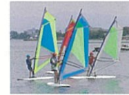
ウインドサーフィン